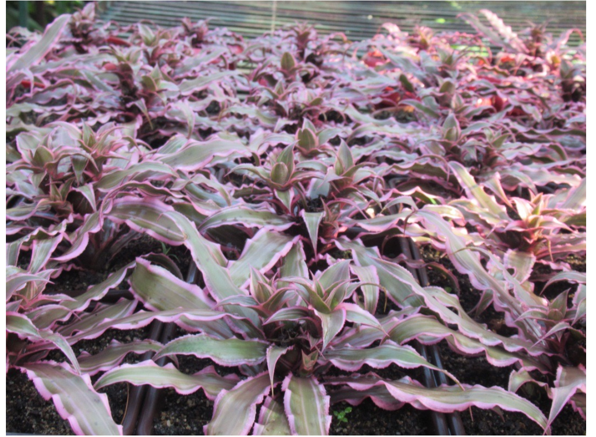
BARI Succulent -1